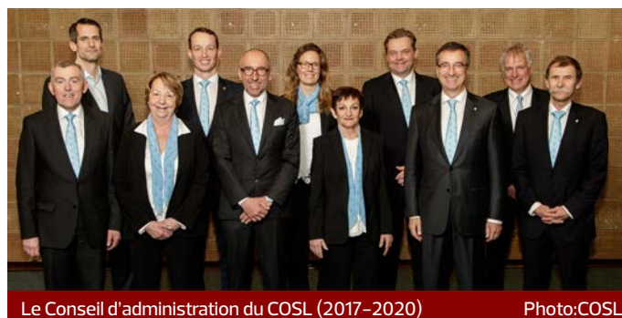
Le Conseil d'administration du COSL (2017-2020)

En 2019, les responsables des Bureaux particuliers et des commissions et groupes de travail ont poursuivi leurs travaux en matière sportive et technique, administrative, financière et