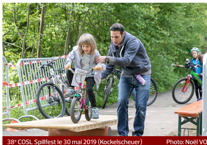
38° COSL Spillfest le 30 mai 2019 (Kockelscheuer)

La Journée Olympique du 14 juin 2019, organisée de nouveau à Cessange sur le site Boy Kohnen elle aussi a connu un grand succès qui s'explique entre autres par l'organisation parfaite de l'événement largement facilitée par l'équipe du COSL, sous la direction du Groupe de travail dédié à la Journée Olympique. L'encadrement des enfants dès la matinée, avec un service «catering» très satisfaisant sur un site de premier choix sont d'autres facteurs de réussite de la Journée Olympique. 130 enfants du cycle 4.1 et du cycle 4.2. ont participé aux différents ateliers suivant la devise «bouger, apprendre et découvrir».