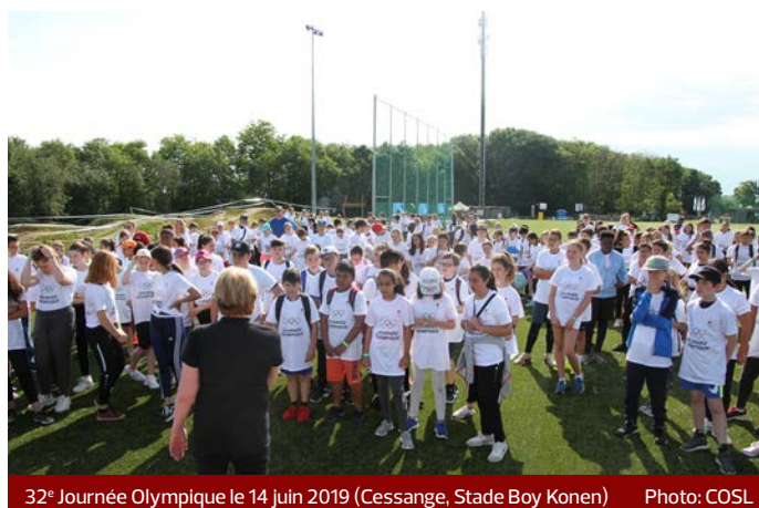
32° Journée Olympique le 14 juin 2019 (Cessange, Stade Boy Kohnen)

Le nouveau plan d'action national interministériel "Gesond iessen - Méi bewegen" (GIMB) présenté le 27 septembre 2018 tient compte des suggestions énoncées lors de différentes journées de réflexion. Ces dernières ont été essentiellement consacrées à une amélioration de l'éducation motrice, physique et sportive pour enfants de la tranche d'âge 0 – 12 ans, l'implémentation du nouveau plan cadre dans les structures d'accueil et d'éducation, de sa mise en place dans certaines institutions telles que les épiceries sociales ou encore dans les centres