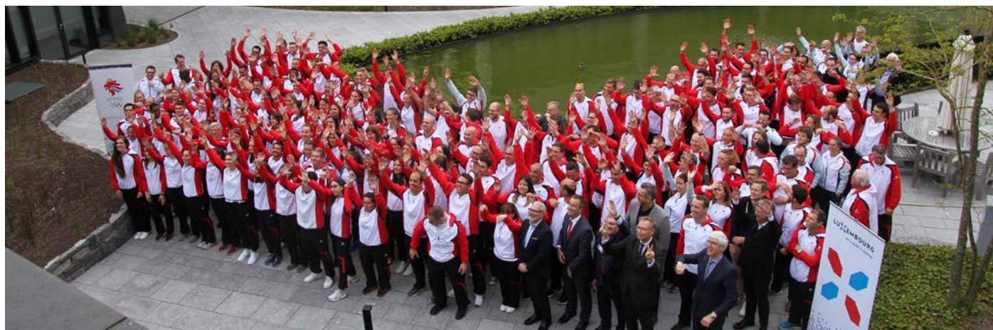
La délégation luxembourgeoise des Jeux des Petits Etats d'Europe Monténégro 2019