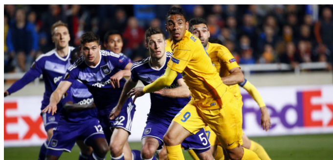
F91 Dudelange vs. Apoël Nicosie (CYP) 4-3

A côté des bonnes performances des athlètes des cadres du COSL, il ne faut pas oublier de mentionner les meilleures performances des représentants des sports d'équipe dans leurs compétitions européennes respectives: en football, l'équipe hommes du F91 Dudelange réalise une première victoire d'une équipe de football luxembourgeoise dans les poules de l'Europa League grâce à sa victoire le 19 septembre 2019 contre l'équipe de Apoël Nicosie (Chypre); l'équipe hommes des Red Boys Differdange se qualifie pour les huitièmes de finales du EHF Challenge Cup après avoir éliminé au troisième tour l'équipe de Nova Vesely (République Tchèque); en volleyball, les équipes nationales (d) et (h) remportent l'édition 2020 du Novotel Cup disputé du 3 au 5 janvier au Luxembourg.