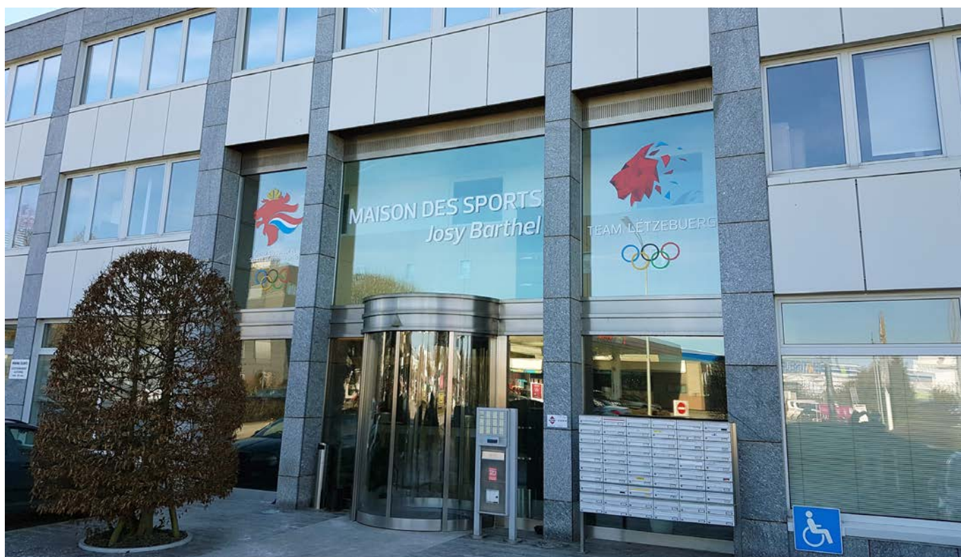
La Maison des Sports Josy Barthel