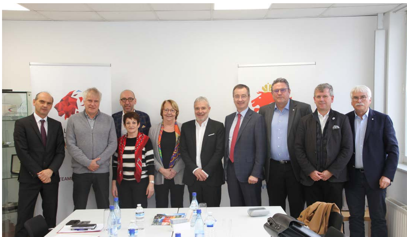
Entrevue Ministère des Sports – COSL 2019