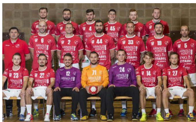
Red Boy Differange