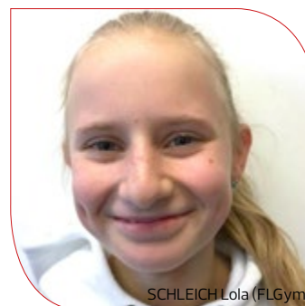
SCHLEICH Lola (FLGym)